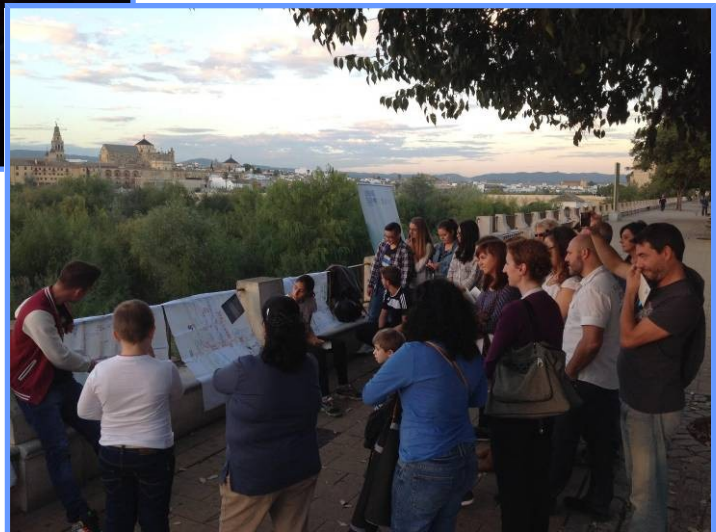
Proyecto “Somos Patrimonio”