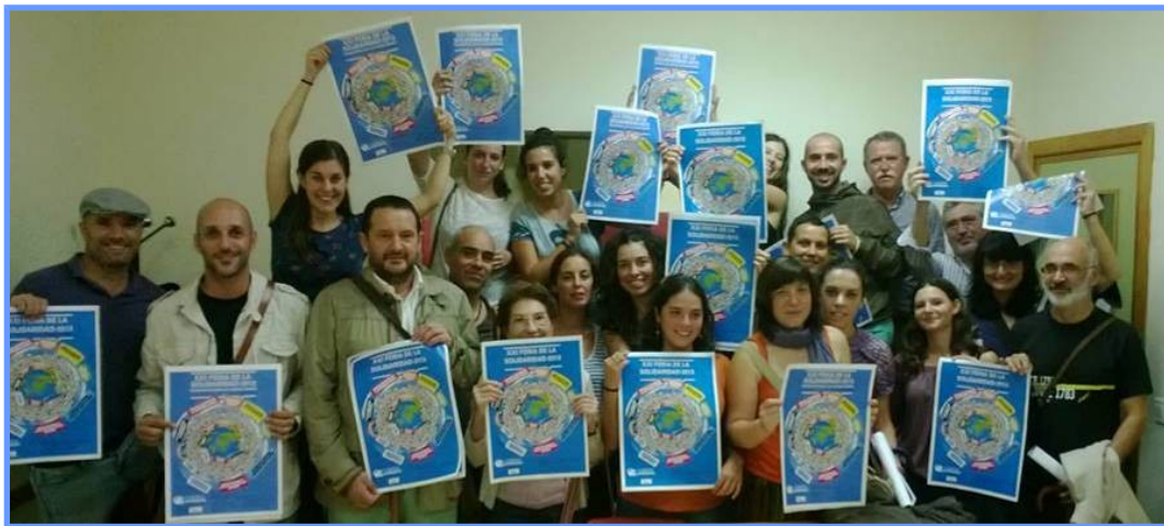
Imagen de presentación de la Campaña "Tu problema es mi problema" de Córdoba Solidaria

Con presencia activa en el Comité Ejecutivo y en los Grupos de Trabajo de Educación para el Desarrollo, Cooperación Descentralizada y Comunicación; así como en el Grupo de Coordinadoras Autonómicas.