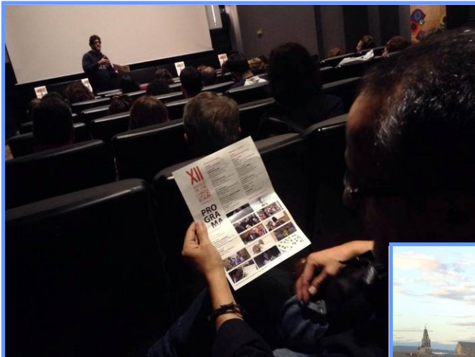
XII Muestra de Cine Social “La Imagen del Sur”