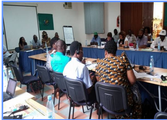
Seminario sobre empresas transnacionales organizado en Maputo por La Vía Campesina