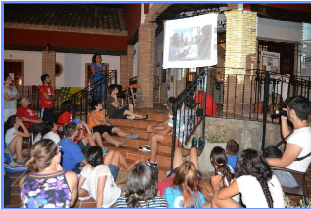
Campamento audiovisual "Imágenes del Sur"

Generar en la comunidad andaluza -en los ámbitos de la educación formal, no formal e informal- procesos participativos y transformadores desde un enfoque de derechos y con una concepción de aprendizaje surgida de la experiencia y la vivencia.