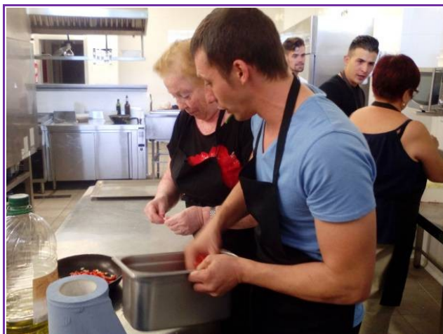
Servicio Solidario del Programa Reincorpora

Esta área está compuesta por un equipo estable de hombres y mujeres que planifican, diseñan y ponen en marcha las estrategias definidas, con el apoyo de un amplio equipo multidisciplinar (en su mayor parte también estable) con dobles perfiles -sociales y tecnológicos- con formación y amplia experiencia en el trabajo específico con colectivos de personas vulnerables o en riesgo de exclusión. Con el objetivo común de la integración social y laboral de las personas.