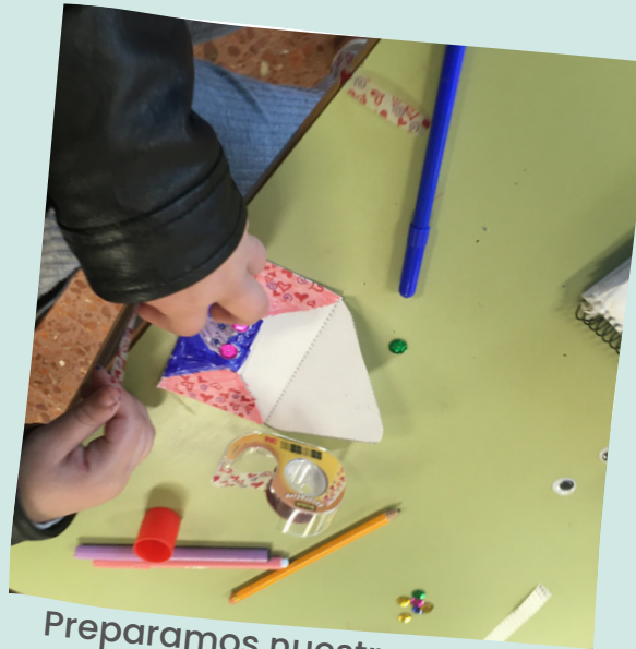
Preparamos nuestro sobre para montar el "Buzón secreto"