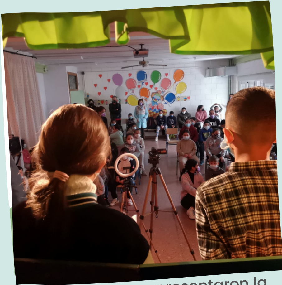
El día 8 de marzo presentaron la obra a los demás cursos de su cole.