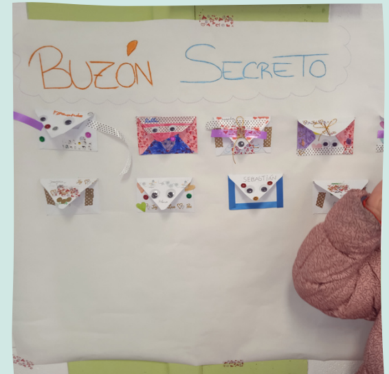
En nuestro buzón secreto nos dejamos mensajes durante todo el curso.